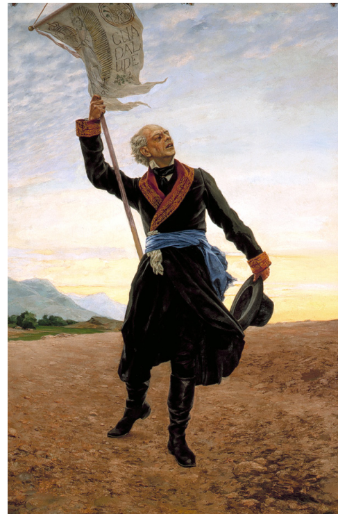
3.2 Målning av Miguel Hidalgo efter en målning av Antonio Fabres Costa

Mexikos självständighetsdag firas till minne av det väpnade upproret 1810, när prästen Miguel Hidalgo, hyllad som nationens fader, uppmanade folket att göra revolt mot det spanska styret. Under ett tal sägs han ha utropat: "¡Viva México! ¡Viva la Independencia!" Länga leve Mexiko! Länga leve självständigheten!