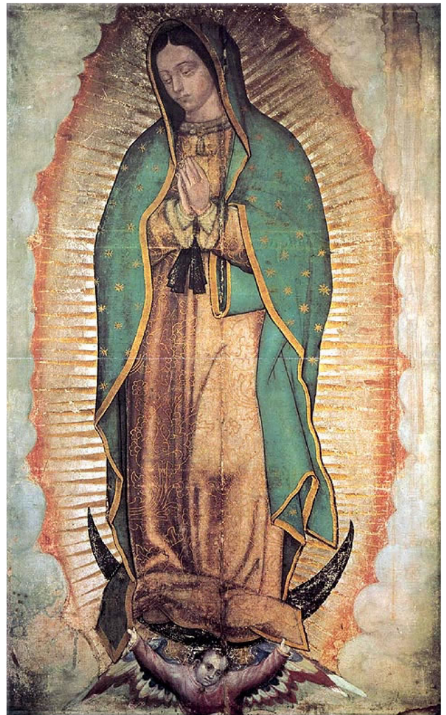
3.4 Målning som föreställer Jungfrun Guadalupe. Världskulturmuseernas samlingar. 1900-tal

När Fader Hidalgo använder en fana med Jungfrun på i kampen för självständigheten stärks värdet av denna ikon och symbol.