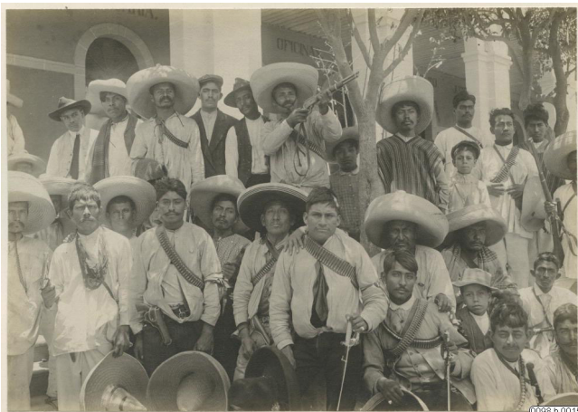
3.1 Fotografi av väpnad milis under Mexikanska revolutionen (1911)

Det mexikanska frihetskriget inleddes år 1810, av prästen Miguel Hidalgo y Costilla. Och efter många års kamp blev Mexiko till slut självständigt år 1821, 300 år efter Spaniens erövring. Men frihetskriget innebar många förluster. Många människor dog och landet blev försvagat. Kanske var det på grund av dessa nederlag som ursprungliga kulturer och traditioner blev så viktiga för Mexiko under den här perioden. Här hade ju människor levt i tusentals år, i stora samhällen och kulturer, innan spanjorerna kom. Detta kulturarv spelade en viktig roll i Mexikos nya, självständiga identitet.